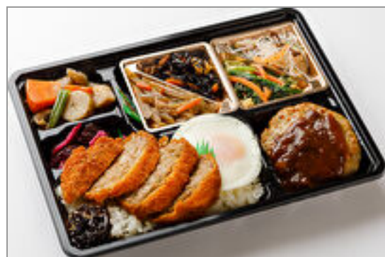
【満腹幕の内】デミハンバ ーグ&ジューシーメンチカ ツ 1,000円(税込1,080円)／品番:TCRA34