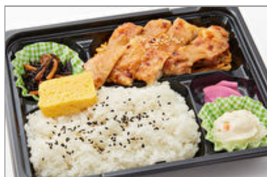
鶏もも柚子味噌焼き 741円(税込800円)／品番:TCRA04