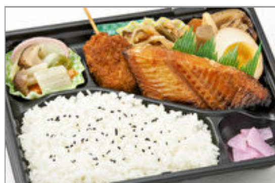
ホッケみりん漬け弁当 825円(税込890円)／品番:TCRA14