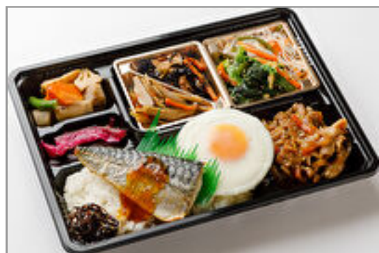
【満腹幕の内】豚生姜焼き &焼きサバ和風おろしソー ス 1,000円(税込1,080円)／品番:TCRA35