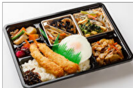
【満腹幕の内】豚生姜焼き &海老フライ 1,000円(税込1,080円)／品番:TCRA37