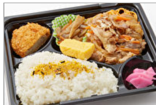
自慢の豚生姜焼き弁当 723円(税込780円)／品番:TCRA01