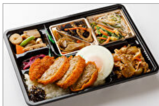
【満腹幕の内】豚生姜焼き &ジューシーメンチカツ 1,000円(税込1,080円)／品番:TCRA39