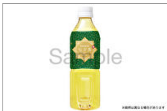
緑茶(500ml ペット ボトル) 121円(税込130円)／品番:TCRA100