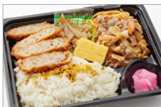
【ダブルメイン】豚生姜焼 き&メンチカツ弁当 825円(税込890円)／品番:TCRA10