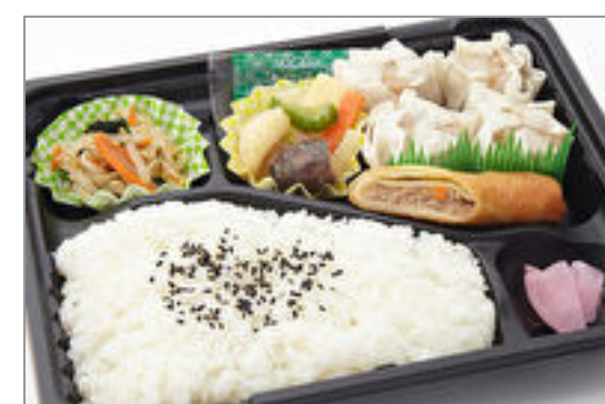
豚肉シューマイ弁当 723円(税込780円)／品番:TCRA29