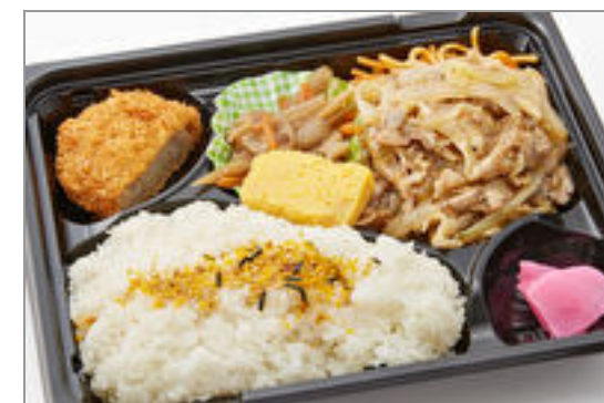
爽やかレモンペッパーポー ク弁当 723円(税込780円)／品番:TCRA02