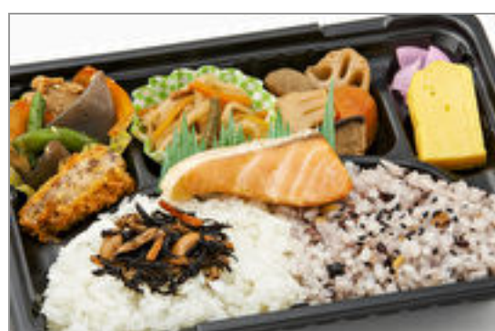
田舎風おかず色々弁当 723円(税込780円)／品番:TCRA09