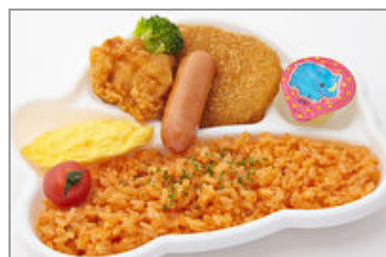
ひよこのお子様ランチ弁当 630円(税込680円)／品番:TCRA31