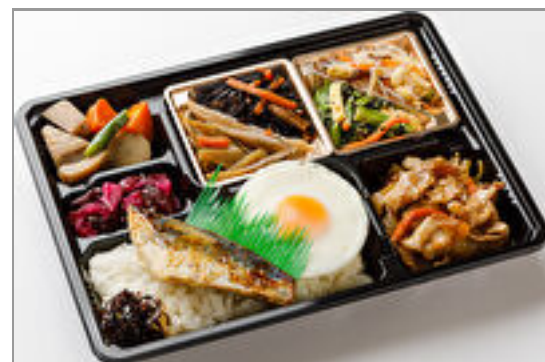
【満腹幕の内】豚生姜焼き &サワラ西京焼き 1,000円(税込1,080円)／品番:TCRA40