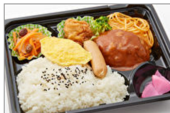
人気おかずの洋風弁当 723円(税込780円)／品番:TCRA05