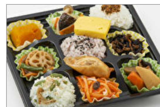
野菜たっぷり20品目弁当 825円(税込890円)／品番:TCRA13