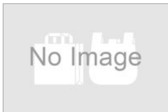
小分け用ビニール袋 3円(税込3円)／品番:TCRA1003