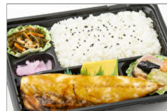
焼きサバの和風おろしソー ス弁当 723円(税込780円)／品番:TCRA08