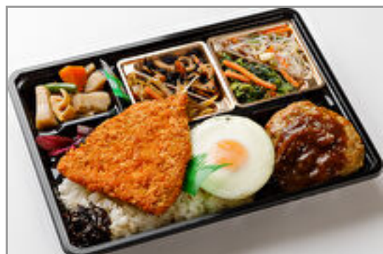
【満腹幕の内】デミハンバ ーグ&肉厚アジフライ 1,000円(税込1,080円)／品番:TCRA38