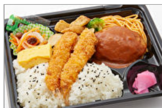
【ダブルメイン】煮込みハ ンバーグ&エビフライ弁当 825円(税込890円)／品番:TCRA11