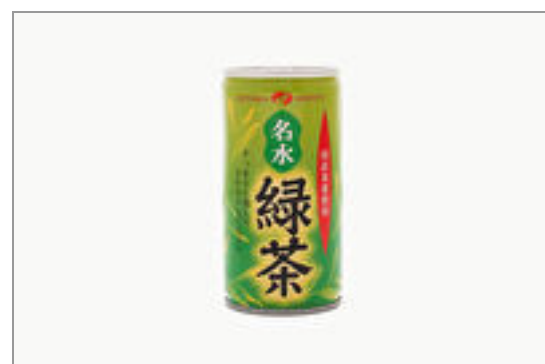
緑茶(190ml 缶) 84円(税込90円)／品番:TCRA102