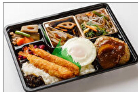
【満腹幕の内】デミハンバ ーグ&海老フライ 1,000円(税込1,080円)／品番:TCRA36