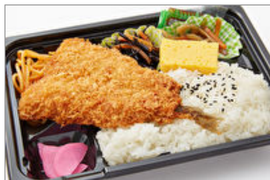
【お買得】肉厚アジフライ 弁当 600円(税込648円)／品番:TCRA27