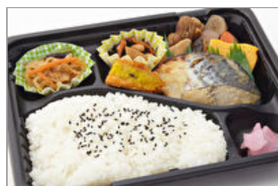
さわら西京焼き弁当 723円(税込780円)／品番:TCRA28