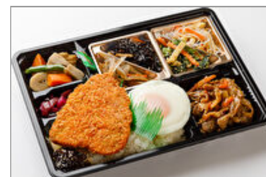
【満腹幕の内】豚生姜焼き &肉厚アジフライ 1,000円(税込1,080円)／品番:TCRA33