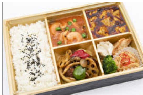
中華御膳【肉団子のカレー風味炒め】 1,500円(税込1,620円)／品番:MGBS008 お茶付き