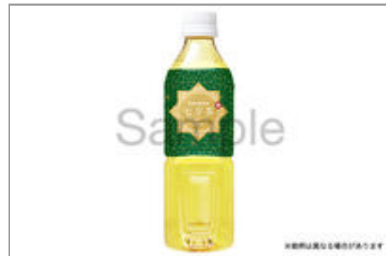
緑茶(500ml ペットボトル) 112円(税込120円)／品番:MGBS802