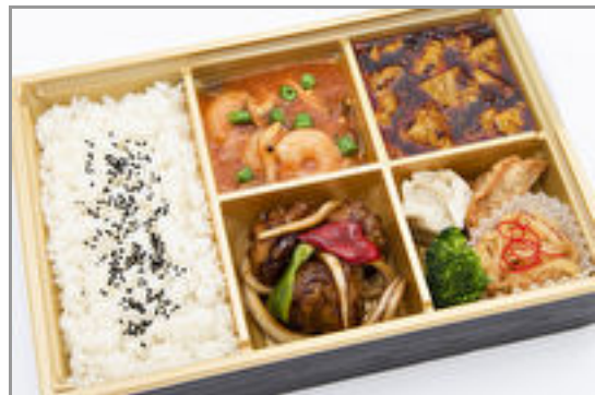
中華御膳【豚ヒレ肉の黒酢酢豚】 2,000円(税込2,160円)／品番:MGBS007 お茶付き