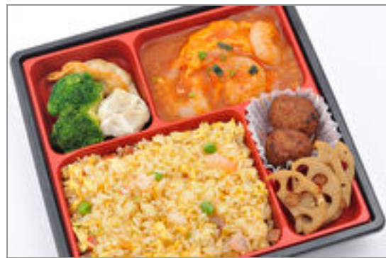
炒飯弁当【まろやかエビチリ玉子】 1,112円(税込1,200円)／品番:MGBS019