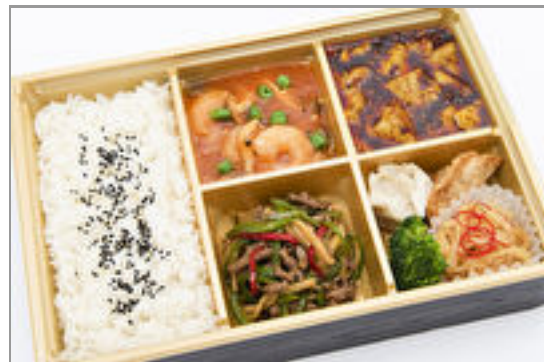
中華御膳【特選牛のチンジャオロース】 2,000円(税込2,160円)／品番:MGBS006 お茶付き