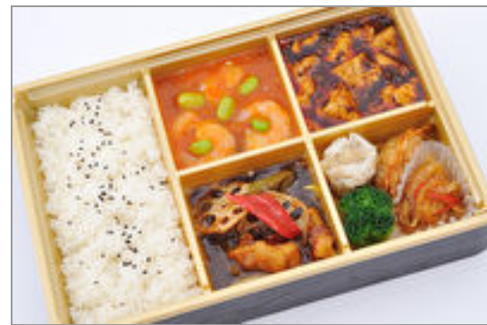
中華御膳【白身魚の油淋ソースがけ】 1,800円(税込1,944円)／品番:MGBS009 お茶付き